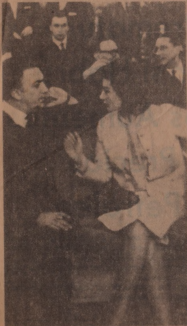
Federico Fellini con Anouk Aimee.

De cómo se llega a ser un gran escritor sin abandonar un ínfimo pueblecito y aún una alcoba algo sórdida, podría titularse el responso fúnebre, porque estos ciento cincuenta volúmenes cuentan incesantemente el insignificante pueblo de Guéret donde nació en 1888, hijo de un implacable carnicero y de una madre con la que sostuvo una de las más amorosas relaciones que se conozcan, más prolongada y memorable que la de Marcel Proust y su madre; cuentan la vida de sus innumerables animales, a la manera de Collette con sus gatos; los personajes ínfimos que repiten cotidianamente sus gestos y palabras en el estrecho círculo de un pueblecito feo y sin carácter.