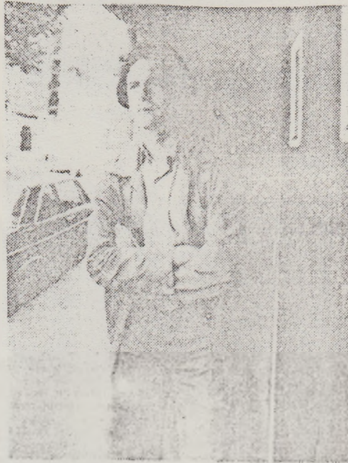
A los 33 años, Patrick Modiano ha alcanzado su madurez de escritor.

mos hacer con esa acorazada memoria personal que es (o fue) nuestro orgullo.