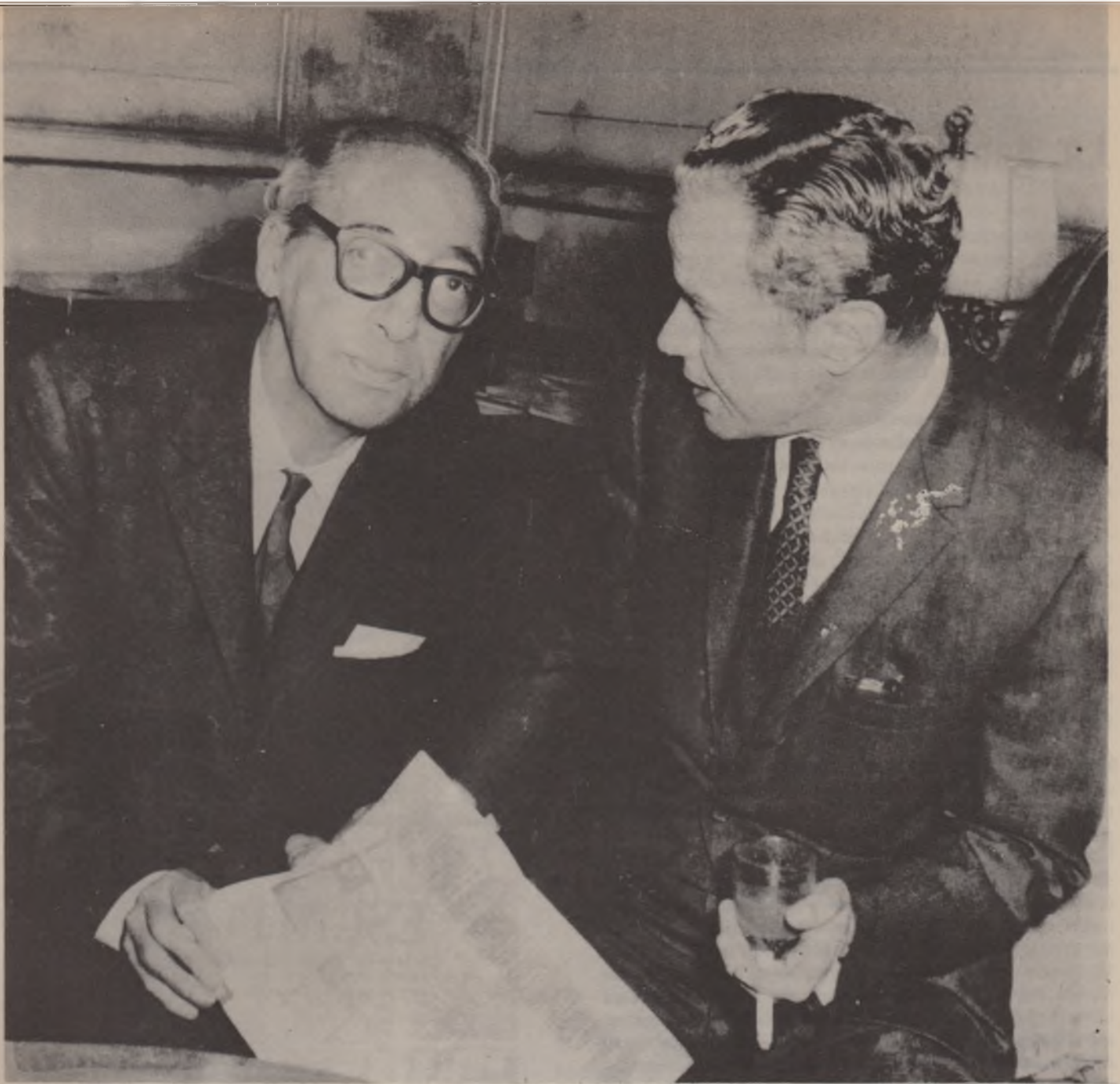
Dos grandes de América Latina reunidos en 1969: Juan Carlos Onetti y Juan Rulfo. Ambos escondidos y ambos admirados, aunque no entraron al "boom".

capaces. 1938, mostró que la resistencia al golpe de Estado había equivocado el camino. Para vencer a la reacción no se podía transitar por los mismos caminos de ella, buscar el apoyo de las mismas fuerzas que habían reclamado el golpe o lo habían tolerado. El tiempo, bien corto por cierto, no tardó en demostrarlo. Cuando los núcleos políticos desalojados el 31 de marzo, volvieron al gobierno, dejaron en pie no sólo las estructuras que habían posibilitado el golpe, sino también las propias construcciones de la dictadura. Se reinstalaron en el edificio conservado y reacondicionado o adornado por ésta. Todo siguió como antes y la lucha que contra la reacción se inició el 31 de marzo, en vez de abrir nuevas alternativas al país, se diluyó en una oscura confusión" ( "Marcha" 1248, 26/III/1965).