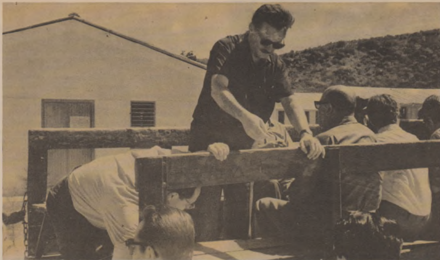
Mario Benedetti en Cuba. Definición de una trayectoria, tanto más ejemplar, cuando otros terminaron en los Estados Unidos.

es decir a la infancia y adolescencia en los años veinte.