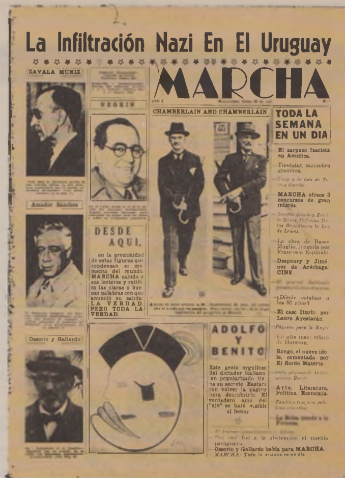
Una tapa ya clásica: el primer número de "Marcha" en 1939.

el crítico al proceso evolutivo de las letras comprometiendo en las demandas de una sociedad y situar el interés sobre los escritores de la comunidad latinoamericana, de Carpentier a El Techo de la Ballena, de García Márquez a Vargas Llosa. Fue también la lección del tiempo porque la revolución cubana, la apertura del nuevo marxismo, el desarrollo de las ciencias de la cultura, las urgencias de la hora, marcaban nuevos derroteros, como fácilmente se lo puede comprobar en la evolución de críticos mayores como Real de Azúa o Mario Benedetti.