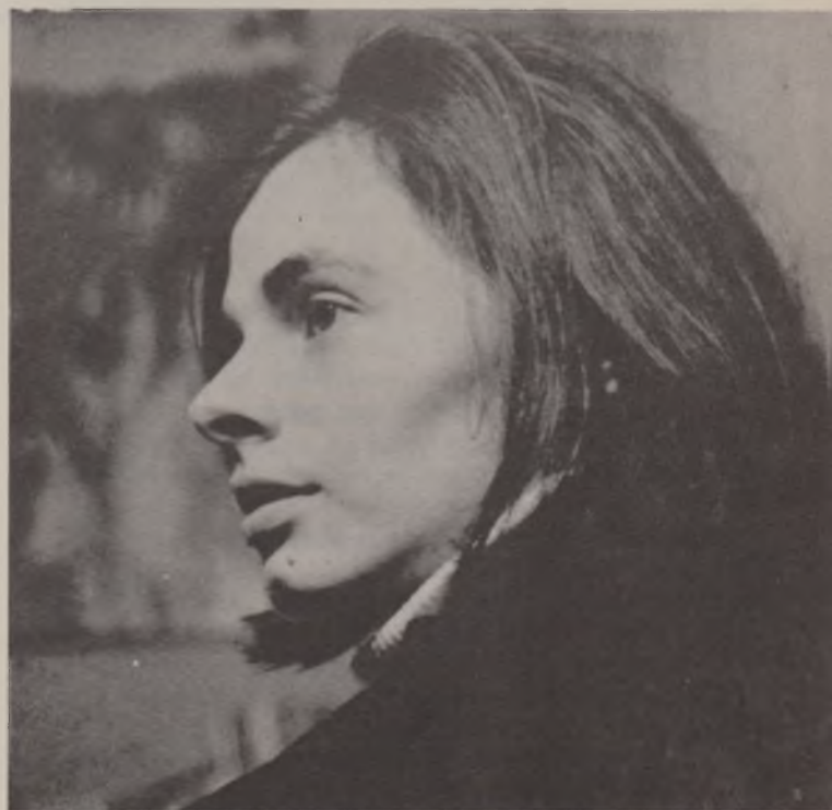
Cristina Peri Rossi, "Premio de los Jóvenes" de Arca y Premio de Marcha, apunta una nueva inflexión de nuestra literatura.

En los tramos posteriores no ha hecho sino aguzarse esta vocación de independencia, con la instalación de circuitos privados de comunicación, que tienen sus formas exitosas en los teatros de aficionados, en los cineclubes y en las editoriales, tratando de crear un autoabastecimiento que conocen las aportaciones de la tecnología reciente: televisión.