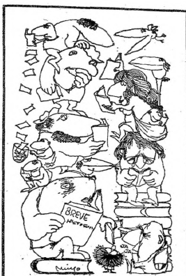
DIBUJO DE MUYO

Conviene señalar un curioso desequilibrio respecto a la Argentina, que se produce en el período peronista 1945-1965, porque ilustra acabadamente de las dificultades para fundar una industria editorial uruguaya. En ese período las tensiones entre Perón y nuestro país llevaron a casi interrupción de relaciones; no se podía viajar, no se comerciaba, los turistas argentinos no podían venir a verse en Punta del Este y tampoco podían venir las comitivas de "Sanctus que con sus patchadas ocupaban nuestros teatros doce meses cada año. El efecto, ya su estudiado y conocido, fue que, privado el país de la asistencia de comediantes argentinos, contribuyó poderosamente a facilitar el desarrollo de nuestros teatros, al desahucándose la Comedia Nacional y fortificándose